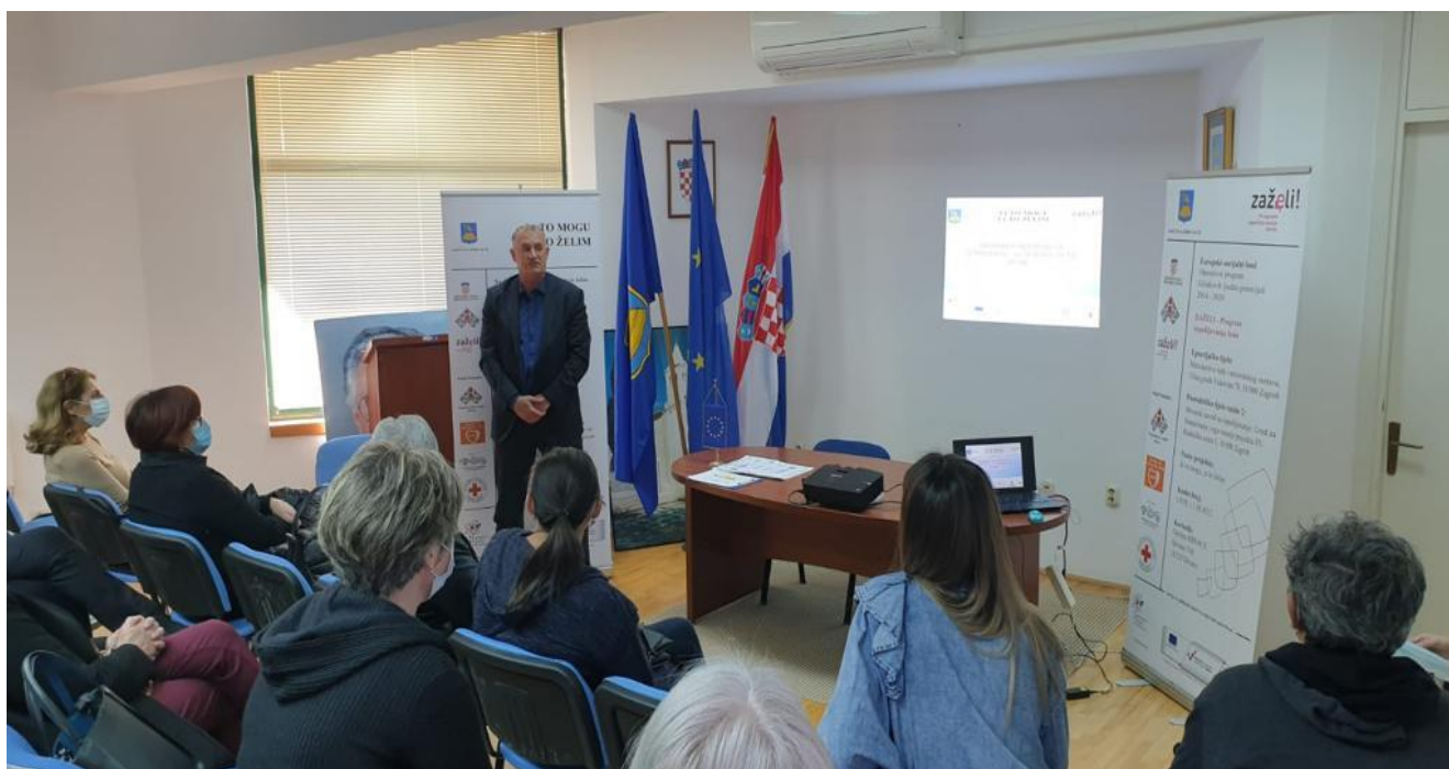
Nastavak programa „Zaželi“

Navedenim programom osigurao se posao za 50 –ak djelatnica koje obavljaju poslove potpore, podrške i brige za 250 starijih osoba. Očekujemo da će se program nastaviti i u drugom dijelu godine.